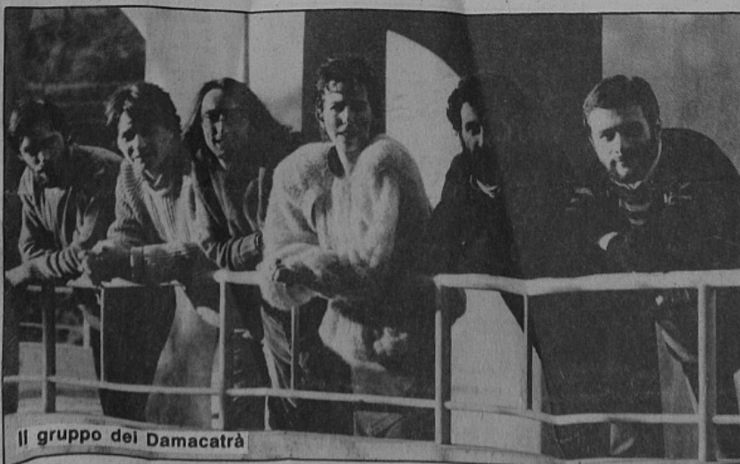
Il gruppo dei Damacatrà